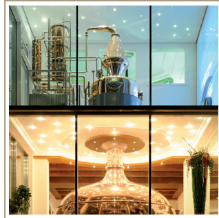
Rugen Distillery mit Sudhaus

In Interlaken, im Herzen des Berner Oberlandes, liegt die 1866 gegründete Bierbrauerei Rugenbräu AG. Sie ist seit 1892 im Besitz der Familie Hofweber. Unter dem Motto «Der Biergenuss aus dem Berner Oberland» wird seit über hundert Jahren am Rugen Bier gebraut. Das traditionelle Angebot von Lager- und Spezialbier wurde im Laufe der Zeit mit besonderen Bier-Spezialitäten ergänzt. Selbstverständlich setzen wir nicht nur auf Produkte-Innovationen, sondern investieren laufend in neuste Technologien.