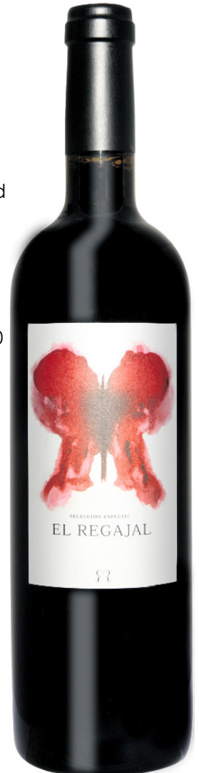
Erhältlich in 75 cl