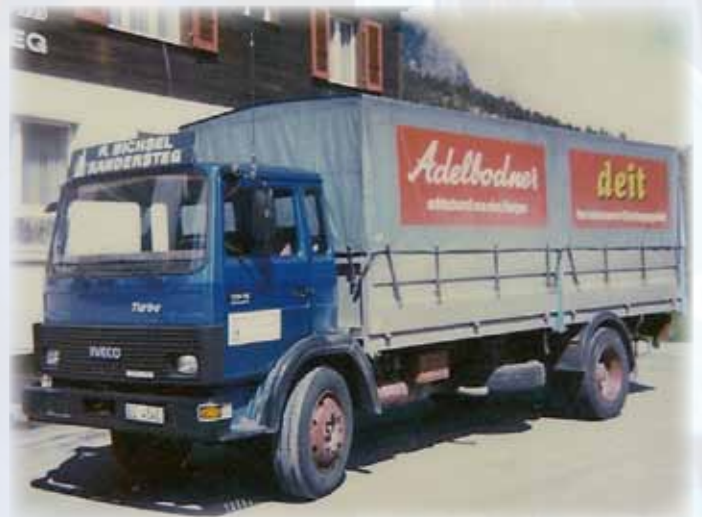
Lastwagen Magirus Iveco

Der Getränkehandel von Rudolf Bichsel wächst stetig. So muss eine Halle für das Leergut angebaut werden. Grosse Lieferungen können jetzt mit dem neuen Magirus Lastwagen schneller und effizienter erfolgen.