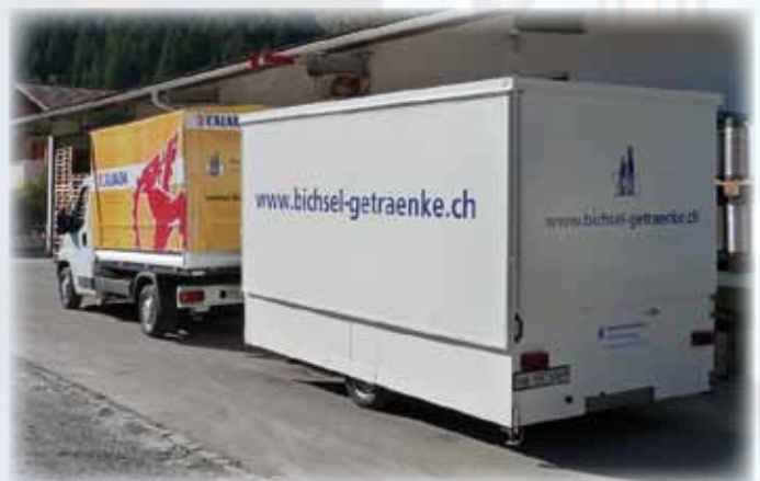
Peugeot Boxer mit Barwagen